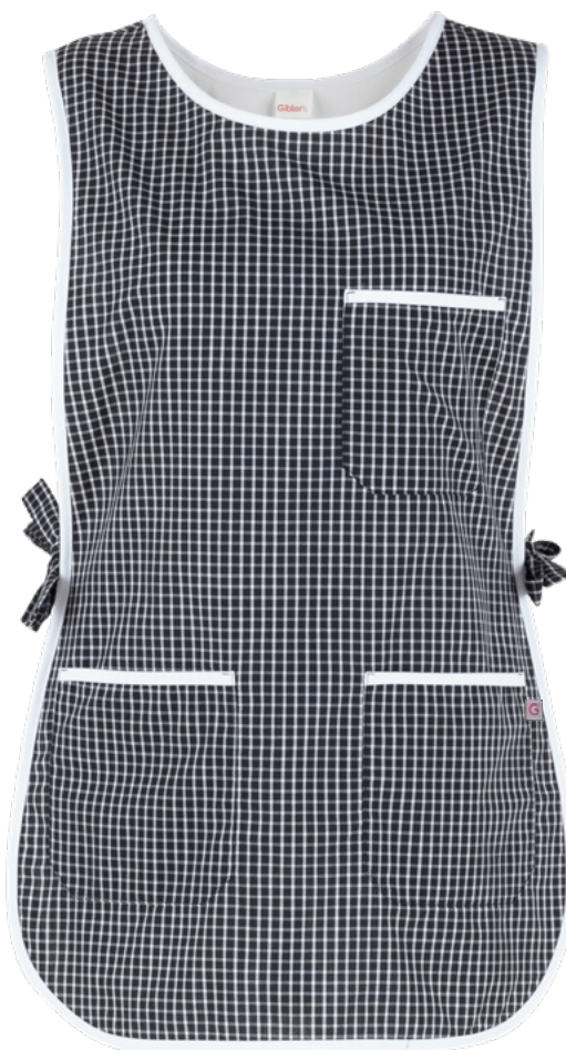
Q32 Quadro nero